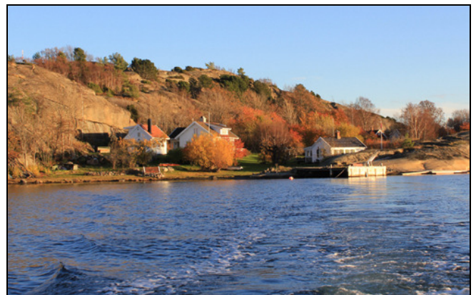
Fra Vasskalven, Tjøme

Skjærgården øst for Nøtterøy/Tjøme er et av landets 22 utvalgte kulturlandskap i jordbruket. Områdene er valgt ut fordi de har store biologiske og kulturhistoriske verdier. Området dekker hele skjærgården øst for Nøtterøy og Tjøme og grensene er i stor grad de samme som Ormø-Færder landskapsvernområde.