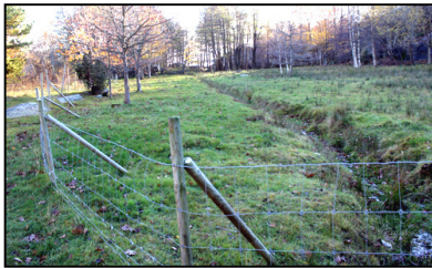
Eksempel på gjerding til sau

Vi har i år fått 90.000,-kr til fordeling av SMIL midler. Det kan bl.a. søkes om midler til tilrettelegging for økt tilgjengelighet i kulturlandskapet, skjøtsel, vedlikehold og istandsetting av gammel kulturmark, bevaring av kulturminner, anleggelse av fangdammer og åpning av gjenlagt bekker. Ta kontakt med landbrukskontoret i for mer informasjon. Det kan gis tilskudd inntil 70% av godkjent kostnadsoverslag.