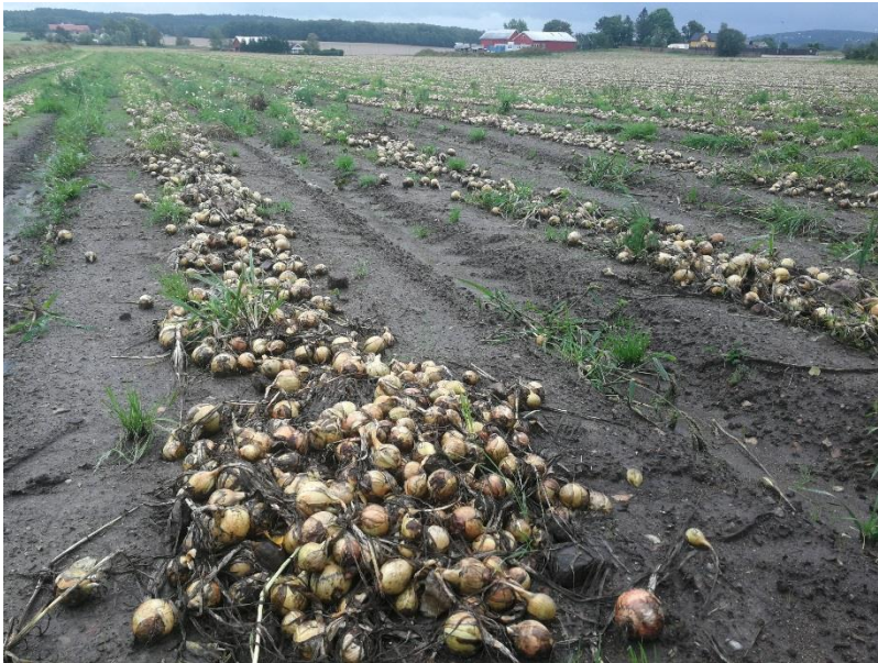
Løk som ligger til ettermodning. Kjærnes på Ås.