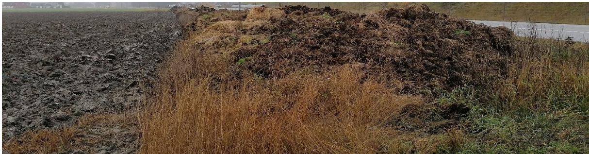
Utendørs lagring av talle kan føre til utslipp mot vassdrag. Overdekking med duk er aktuelt.

Bruker er ansvarlig for lagringa. Gjødselvarer skal lagres slik at det ikke er fare for avrenning til drikkevannskilder, vassdrag og sjø , samtidig skal ikke lokal lagring forårsake unødige luktulempet. Fast gjødsel kan lagres ute på bakken når tørrstoffinnholdet er over 25 %. Det ser ikke ut til at alle oppfyller dette kravet. I tillegg ser det ut til at regn direkte på gjødselhaugene vasker ut gjødsel slik at gjødselvann ligger langs kantene av haugene. Dette skjer selv om tørrstoffkravet er godt over kravet, som i heste- og fjøfegjødsel. Dersom dere ser gjødselvann i kanten av haugene, skjer det avrenning fra haugene. Tiltak som overdekking av duk eller halm, evt. seng av halm ved foten av haugene, bør iverksettes for å følge forskriftens krav. Kommunen kan sette krav til skjerming mot nedbør. Det ser ut til at svært mange bør forberede seg på å måtte skjerme fastgjødsellagrene sine mot direkte nedbør.