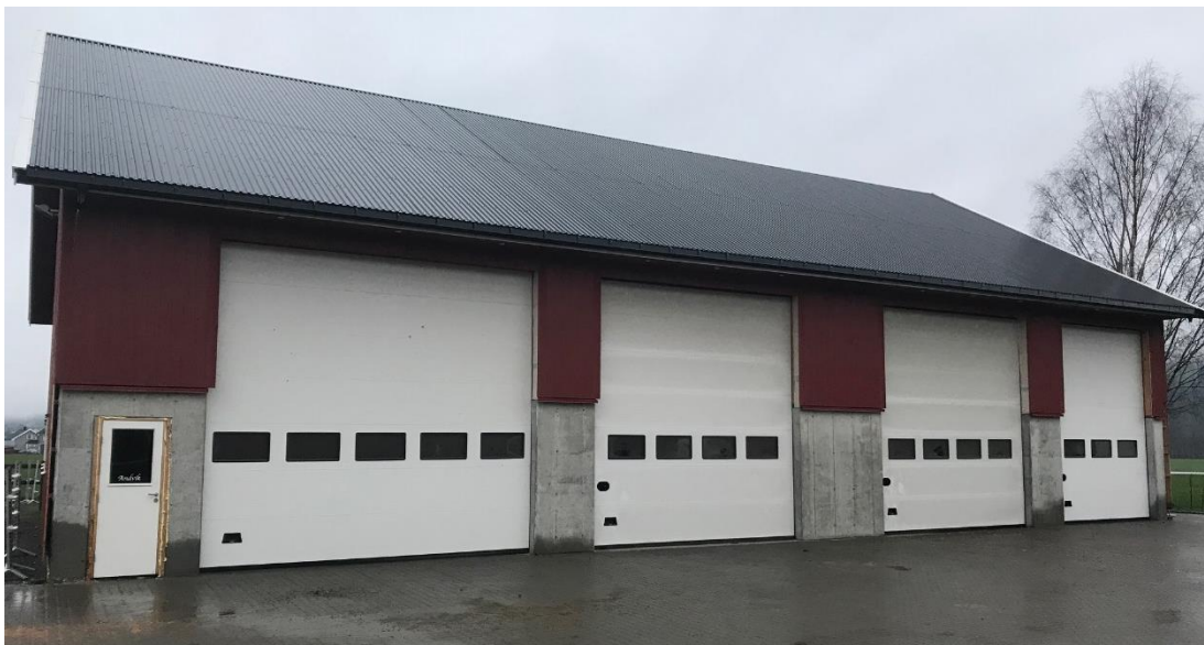
Korntørke, lager for flis og flisfyringsrom i dette bygget.

https://www.innovasjon norge.no/landbruk Vi kan veilede, avklare og hjelpe deg videre.