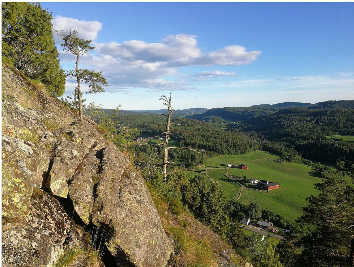
Utsikt sørover mot Vivestad fra Lønnskollen.