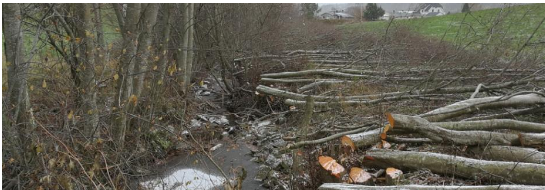
Tynne i kantsona er greit, men ikke snauhogst som her.