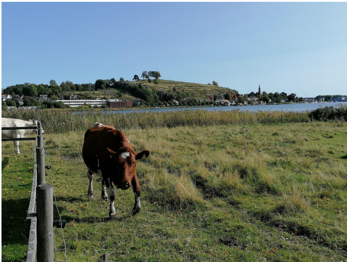
Godt å være ungdyr i Ilene naturreservat. Slottsfjell i bakgrunnen.

Vi på landbrukskontoret ønsker deg en god sommer!