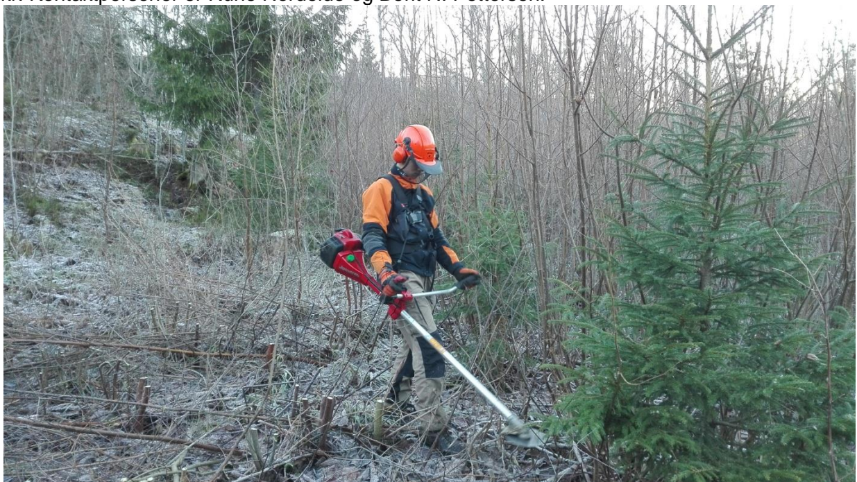
Her gjør ryddesaga og en ungdom godt arbeid!