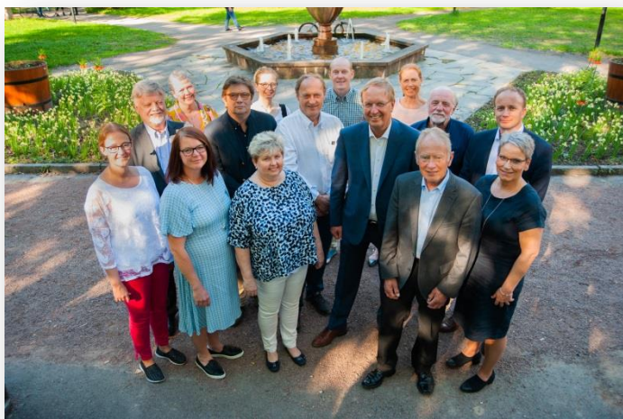
Fellesnemnda for Re og Tønsberg

Når kommunevåpenet foreligger i ulike fargealternativer, ønsker fellesnemnda at innbyggerne i Re og Tønsberg igjen skal få muligheten til å uttale seg om hvilket alternativ de ønsker.