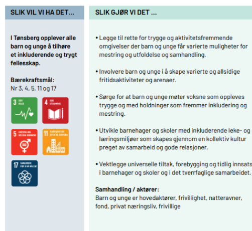
Figur 1 Utsnitt fra gjeldende samfunnsdel som viser hovedmål, delmål og strategier innenfor et satsingsområde.

I SAMHANDLING MED BARN OG UNGE SKAPER TØNSBERG VARIERTE ARENAER FOR INKLUDERING OG MANGFOLD, MESTRING OG AKTIVITET.