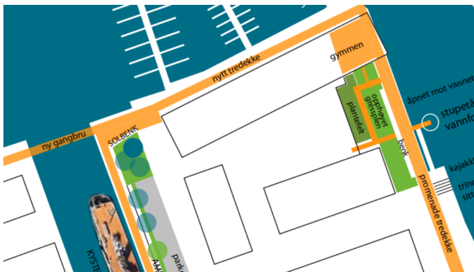
Utsnitt skissebok s. 34

Selvaag bolig utførte selv en evaluering av Kaldnes brygge i 2020 utført av Rodeo arkitekter som støtter opp om dette. Selvaags rapport peker særlig på misnøye med dårlig vedlikehold og uavklarte forhold rundt driftsansvar, samt behov for et mer variert aktivitetstilbud og utforming av uterom ( gjerne rettet mot eldre).