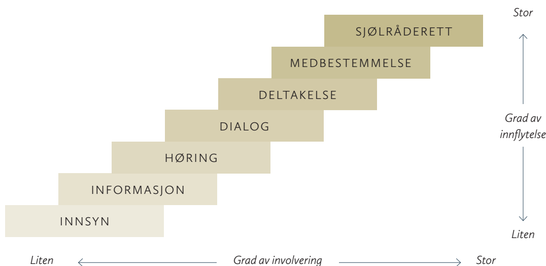
Figur 2 Medvirkningstrappen

Medvirkning betyr at innbyggerne i et samfunn er med på selv å planlegge sin framtid. (NOU 2001:7)