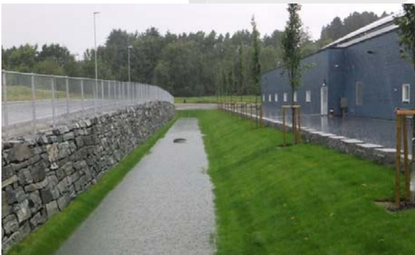
Infiltrasjonsbasseng ved Randaberg Arena. Bassenget er normalt tørt.

Forsedimenteringsbassenget tømmes regelmessig, ca hvert 2.-4. år. Utover dette er det ikke behov for tilsyn.