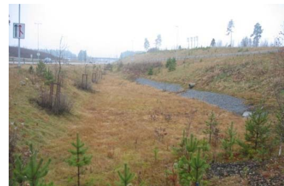
Infiltrasjonsløsning for håndtering av overvann fra vei. Innløp til høyre i bildet. Overløpskum koblet til underjordisk pukkmagasin til høyre som treer i funksjon ved ekstraordinær tilrenning eller tele i bakken (E16 Gardermoen, Jessheim).