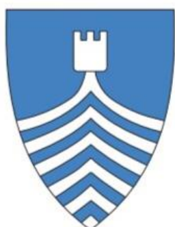
ALT 8: BAUG MED TÅRN