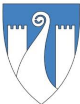
ALT 2: BYGDEBORG OG STAVN 1