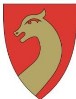
ALT 6: DRAGEHODE RØD