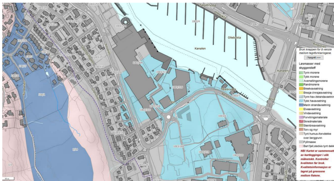
Figur 3: Løsmassekart av planområdet (NGU-kart)

Løsmassekart fra NGU (Figur 3) oppgir at planområdet består delvis av fyllmasser (grå farge), og delvis av tykk havavsetning (lys blå farge).