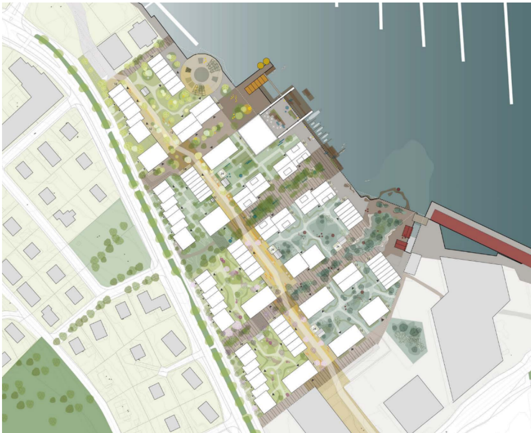
Figur 2: Utsnitt av utomhusplan