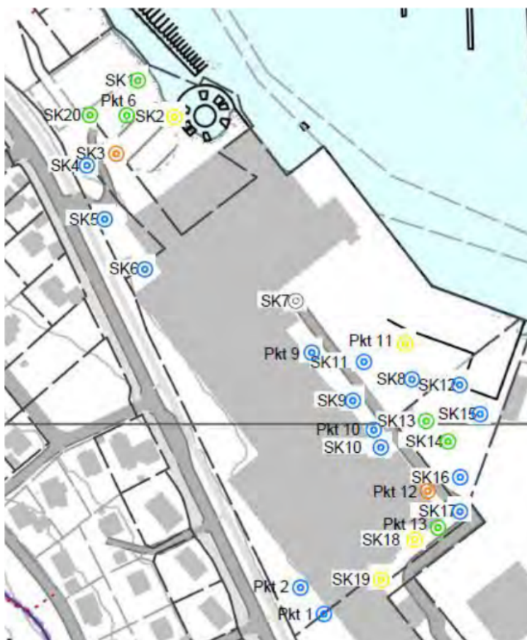
Figur 5: Forurensningsgrad med høyeste påvist forurensning over området. Fargekoder: tilstandsklasse 1 = blå, tilstandsklasse 2 = grønn, tilstandsklasse 3 = gul, tilstandsklasse 4 = oransje.

Det ble generelt påvist forurensning tilsvarende tilstandsklasse 2-4 i deler av massene. De fleste prøvene er forurenset av PAH-komponenter eller tungmetaller, og i ett punkt foreligger oljekonsentrasjoner tilsvarende tilstandsklasse 4 i øvre meter.