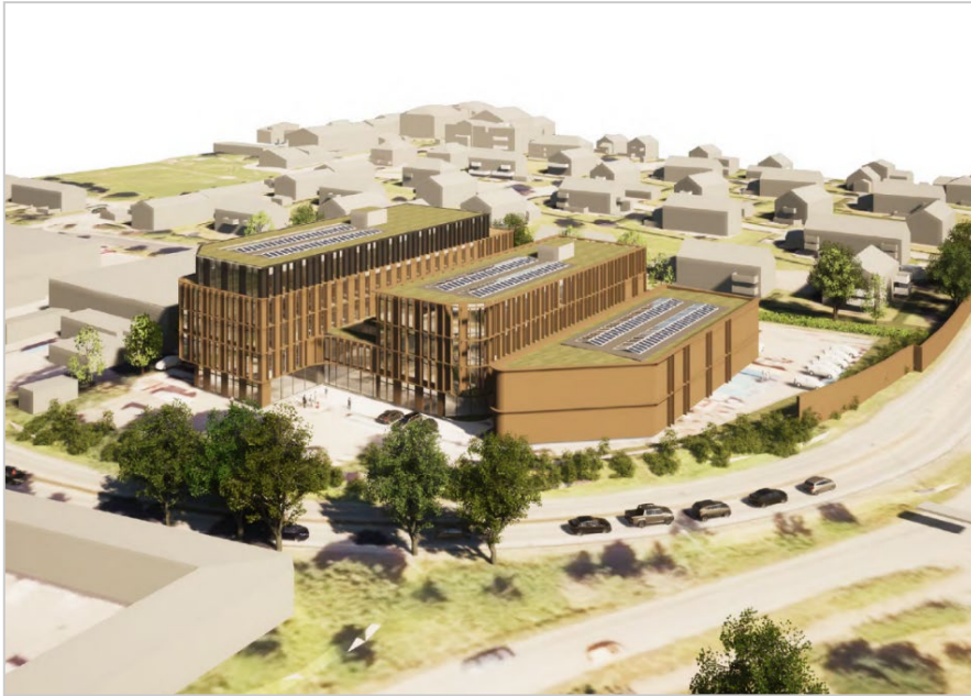
Utsnitt av 3D – illustrasjon for gjeldende plan, vedlegg til planbeskrivelsen (Spir arkitekter AS 06.02.23).