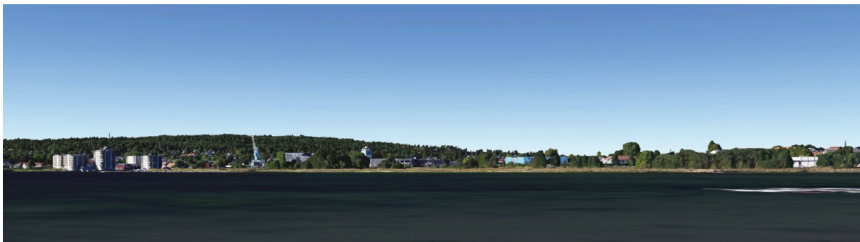
Fjernvirkning dagens situasjon sett fra Råel.

Ved utbygging av kun plasskrevende vareslag, vil ny bebyggelse i all hovedsak innebære en oppgradering og videreføring av eksisterende bygningsmasse. Slik en kan se av illustrasjonen under, er dagens bebyggelse synlig, men gesimsen ligger lavere enn toppen av omkringliggende vegetasjon. Ved nye fasader i en mer dempet farge vil bebyggelsen bli lite synlig og eksponert mot omgivelsene.