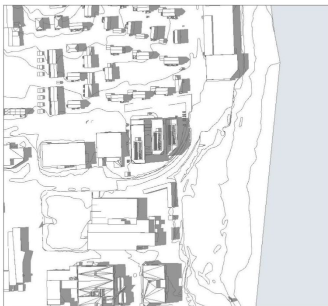
21. JUNI KL 18.00

Hensynet til naboene i boligområdet nord for bebyggelsen var et viktig tema i gjeldende plan. Siden boligene ligger nord for den planlagte bebyggelsen, vil en utbygging i henhold til gjeldende plan gi begrenset med skyggevirking for boligbebyggelsen i sommerhalvåret. I vinterhalvåret, når sola står lavt i syd, vil tilgrensende boliger få dårligere solforhold. Samlet sett har boligene gode solforhold. Sol-/ skyggediagrammet under, viser solforhold på nabobebyggelsen 21. juni kl. 18.00, ved utbygging av eiendommen slik det planlagte prosjektet ble illustrert ved behandling av gjeldende reguleringsplan.