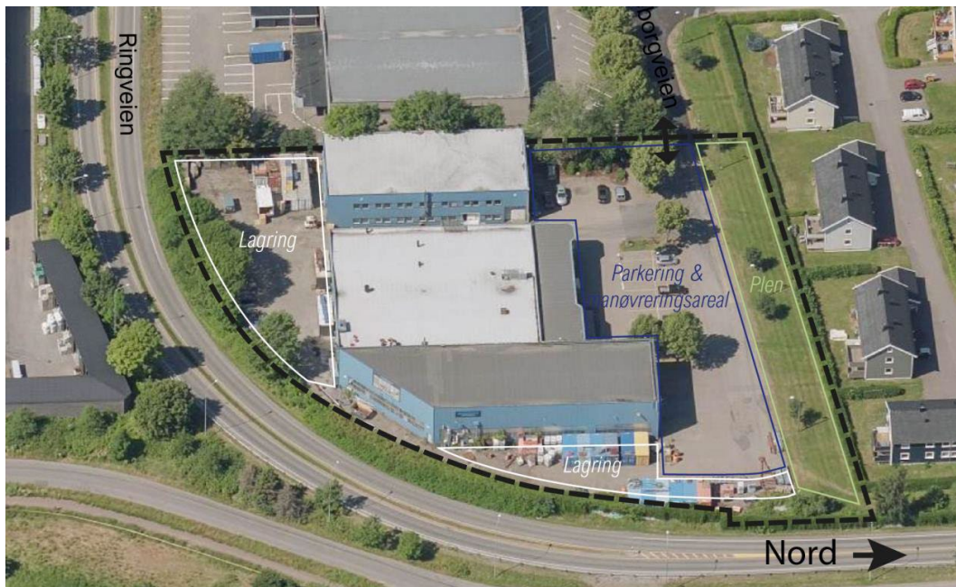
Planområdet sett fra øst (skråbilde hentet fra 1881).

Innenfor planområdet står det i dag tre næringsbygg, med produksjonshall, lager og kontor. Rundt næringsbyggene er det parkeringsplasser og manøvreringsareal for større kjøretøy. Det er noe vegetasjon på området, og et grøntareal mot nabobebyggelsen i nord.