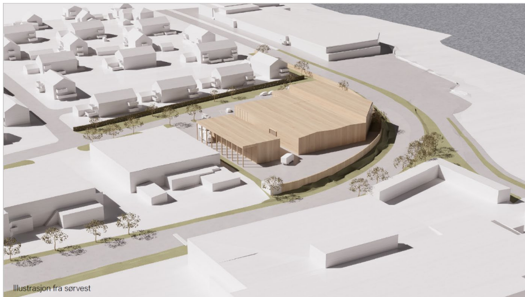
Illustrasjon av planlagt bebyggelse ved etablering av kun plasskrevende vareslag.

Ved etablering av kun plasskrevende varehandel og en utnyttelsesgrad på totalt 3000 m 2 BRA, vil ny bebyggelse i hovedsak bli en videreføring av eksisterende bygningsmasse. Bygningsmassen vil da bli oppgradert i henhold til dagens krav, og tilpasset salg av plasskrevende varer.