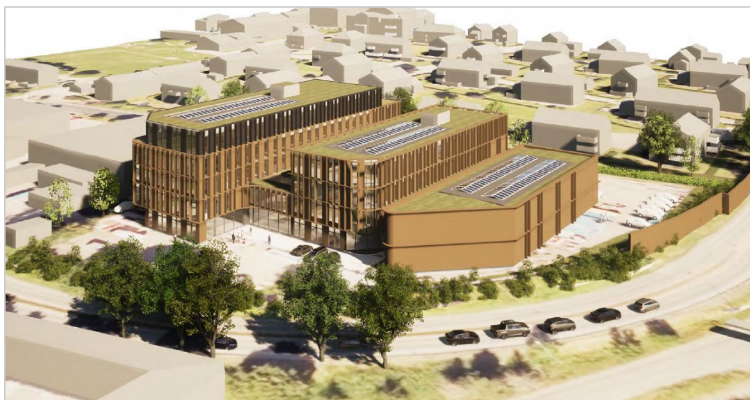
Utsnitt av 3D-illustrasjon for gjeldende plan, vedlegg til planbeskrivelsen (Spir arkitekter AS 06.02.23).

Ved etablering av bebyggelse i tråd med gjeldende reguleringsplan, vil den nye bebyggelse forholde seg til byggehøydebegrensning, utnyttelsesgrad og byggegrenser i gjeldende reguleringsplan. Volumoppbyggingen vil da i utgangspunktet kunne bli tilsvarende det som ble illustrert til behandlingen av gjeldende reguleringsplan.